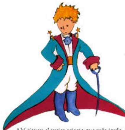
Aquí tienen el mejor retrato que más tarde logré hacer de él

Me puse en pie de un salto como herido por el rayo. Me froté los ojos. Miré a mi alrededor. Vi a un extraordinario muchachito que me miraba gravemente. Ahí tienen el mejor retrato que más tarde logré hacer de él, aunque mi dibujo, ciertamente es menos encantador que el modelo. Pero no es mía la culpa. Las personas mayores me desanimaron de mi carrera de pintor a la edad de seis años y no había aprendido a dibujar otra cosa que boas cerradas y boas abiertas.